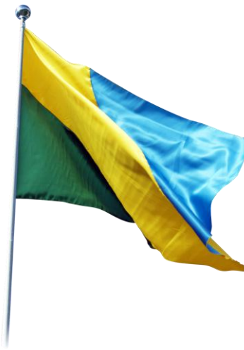
Gráfico 2. Bandera de Pimampiro