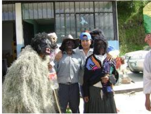
Foto 1. “Fiesta del Guagua Negro” Del 2 al 5 enero - San Francisco de los Palmares, Parroquia CHUGÁ