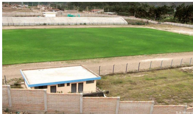
Foto 8. Estadio de la Parroquia