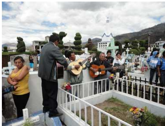
Foto 11. Día de los Difuntos

La Parroquia de Chugá está ubicada al Nororiente de la Congregación de Pimampiro, se encuentra aproximadamente entre los 1750 y 3880 msnm, la cabecera parroquial se encuentra en los 2600 msnm; esta zona está habitada por grupos indígenas y mestizos. Población trabajadora en el área agrícola con amplios paisajes, ríos, montañas y lagos mismos que son los atractivos que tiene este importante sector. Entre sus principales comunidades encontramos el sitio, San Onofre, San Francisco de los Palmares, Palmar Chico, Guagalá y Pan de Azúcar. La creación de la parroquia civil/eclesiástica fue el 28 de marzo de 1955 y su fundación el 16 de octubre de 1955. Entre sus principales manifestaciones culturales encontramos la celebración del Inti Raymi y la fiesta del Guagua Negro.