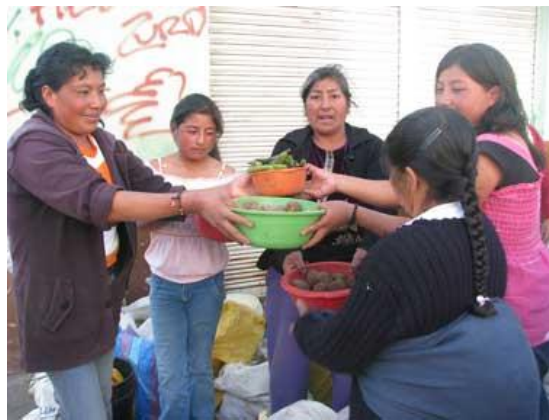
Foto 3. Trueque – Semana Santa”. (Mercado, Procesiones Calles de la ciudad, Liturgias en la Iglesia Matriz)

El carnaval se originó en el 2007 como necesidad de fortalecer la identidad y el rescate de las tradiciones Pimampireñas “Sistema de Valores”. Esta fiesta se había perdido en el tiempo, lo que fue necesario reiniciar la tradición con la participación de las generaciones actuales, para perennizar la fiesta y que sea realizada año tras año con dedicación y esmero por parte de los Pimampireños, como una muestra de una manifestación cultural referente. Tiene repercusión a nivel familiar, interno y externo local, provincial, nacional e internacional.