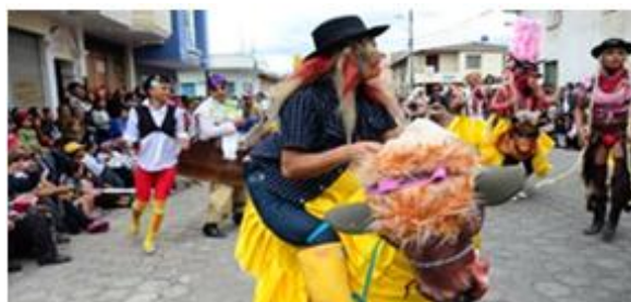
Foto 3. Descripción de las fiestas y tradiciones “máscaras y disfraces”

Se celebra en el mes de enero. Pimampiro (Calles de la ciudad, Polideportivo Municipal)