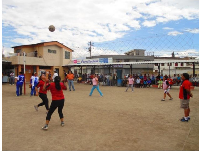
Foto 14. Canchas