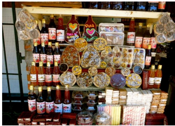
Foto 16. Nogadas

Nogadas: Son dulces hechos con panela y tocte. Su preparación es la siguiente: