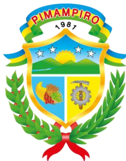
Gráfico 1. Escudo de Pimampiro