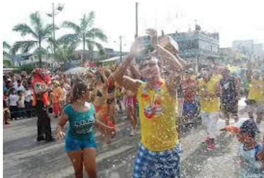
Foto 2. Carnaval y cultura por la vida. Febrero - Pimampiro. (Principales calles de la Ciudad, Río Mataquí y Valle Hermoso, Polideportivo)

La fiesta del guagua negro se origina en la comunidad como una creencia religiosa, ya que según ellos, el “Guagua Negro” les trae suerte y favores que les permite vivir mejor. Es una práctica de padrinazgo y priostes quienes reciben una cantidad de dinero que al siguiente año, la devolución será el doble. Tiene repercusión a nivel familiar, interno y externo, ya que en esta oportunidad quienes migraron vienen a visitarlos. Además con ellos acompañan autoridades locales, provinciales y nacionales, así como turistas extranjeros a nivel de EE.UU. y del país, especialmente de la Costa y el Carchi.