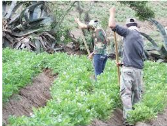
Gráfico 4. Producción Agrícola

En las áreas de ladera se cultiva fréjol, arveja, papas, cebada, trigo entre otros productos típicos de la serranía ecuatoriana