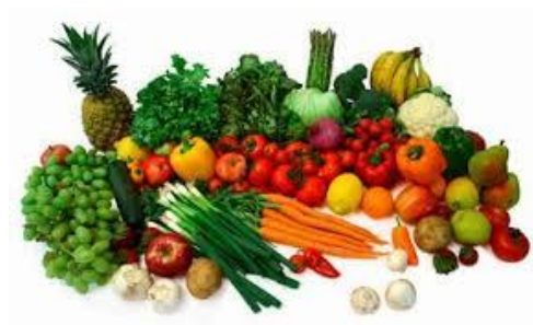
Gráfico 5. Productos Agrícolas

En las áreas de ladera se cultiva fréjol, arveja, papas, cebada, trigo entre otros productos típicos de la serranía ecuatoriana