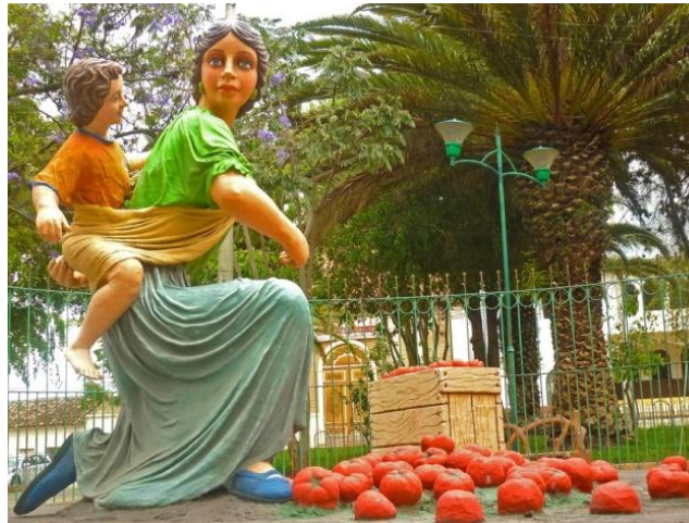
Foto 6. “Mayo” Día de La Madre. Monumento a la madre y el producto más importante de la zona

Los Pimampireños lograron cristalizar su más caro anhelo de independencia un 21 de Mayo de 19981, con el ejecútese al proyecto de Ley por parte del Ex Presidente Constitucional de la República, Dr. Jaime Roldós Aguilera y publicado en el Registro Oficial el 26 de Mayo del mismo año, por lo que a partir de esa fecha, Pimampiro conmemora su aniversario de cantonización con un nutrido programa festivo, con actos sociales, deportivos, culturales que muestran la verdadera identidad de su gente. Por lo general los Pimampireños festejan la fecha entre el 18 y 26 de Mayo de cada año.