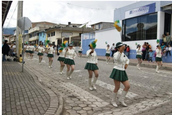
Foto 18. Participación social en el cantón Pimampiro

públicas hacia la ciudadanía no permiten que exista una verdadera participación ciudadana que apunte a un desarrollo integral del cantón.