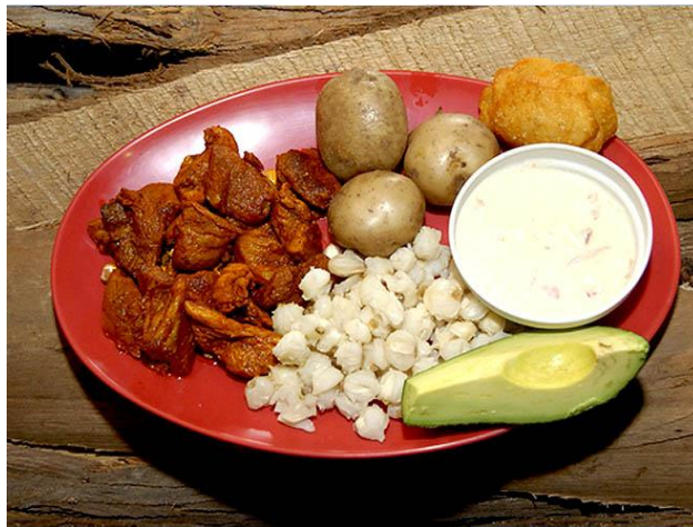
Foto 15. Carnes coloradas

Carnes Coloradas: O carne mechada preparada con achiote. Son sazonadas y secadas al sol, después de una semana se corta en pedazos y luego se las asa. Se acompañan de mote, papas cocinadas, aguacates y salsa de queso. (Otavalo y Cotacachi).