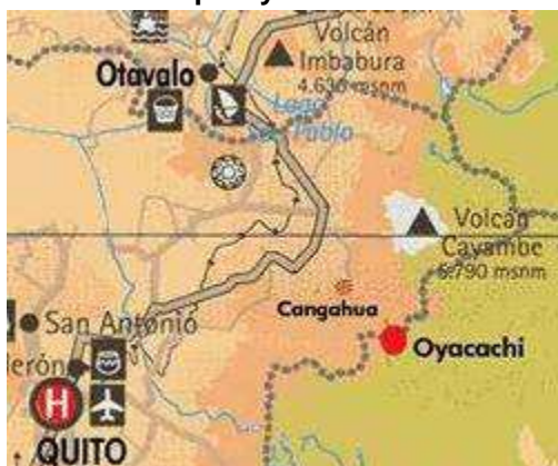
Imagen N° 25 Mapa Oyacachi