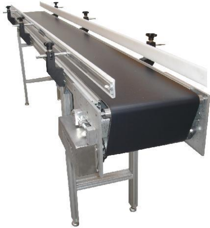
Figura 2: Equipo Transportador Industrial