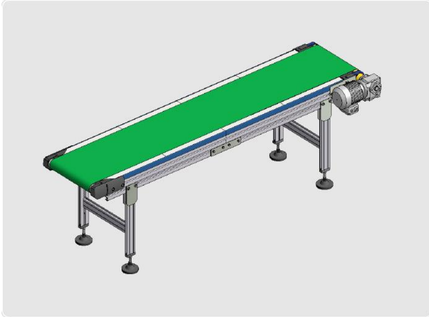
Ilustración en Auto Cad