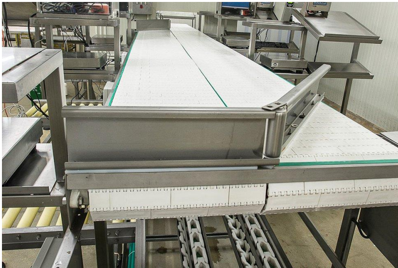
Figure 3: Banda de Fibra sintética en un equipo transportador