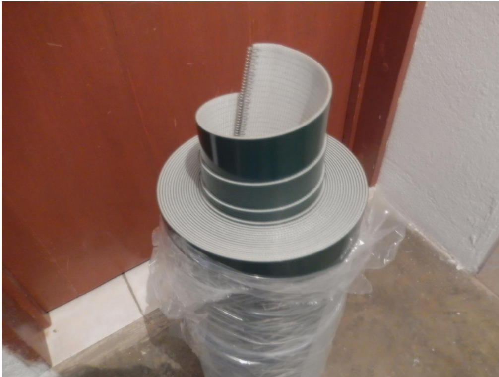
Rollo de banda de fibra sintética