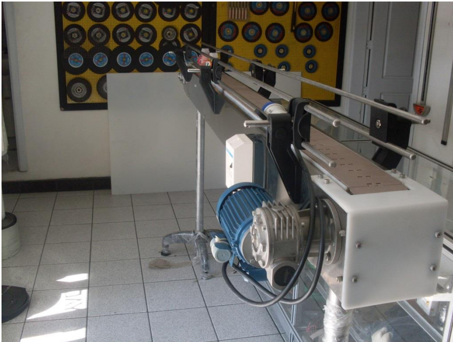
Equipo Fabricado para ARCA ECUADOR S.A Año 2014- Transporte de bebidas