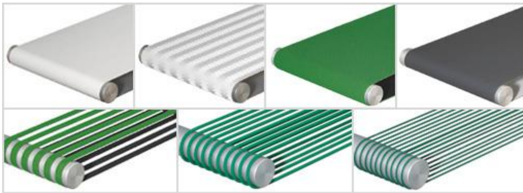
Figura 4: Tipo de Texturas de Bandas Transportadoras