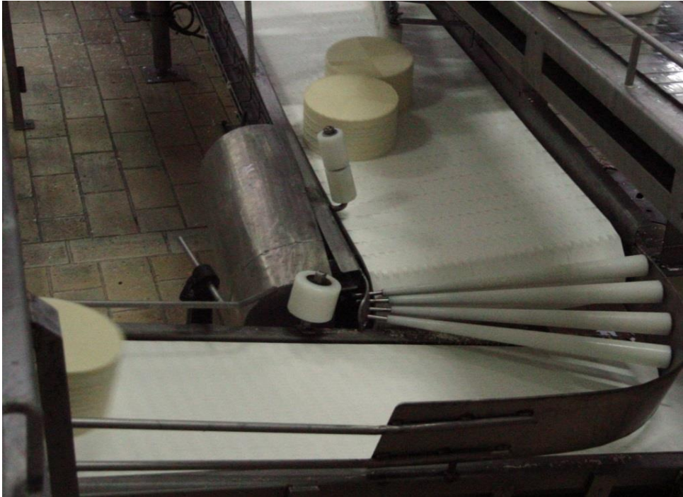
Equipo Fabricado para DULAC S.A Año 2014- Transporte de Lácteos