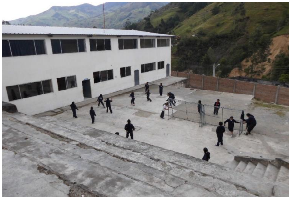
Fotografía N° 3. Graderío a la cancha secundaria.