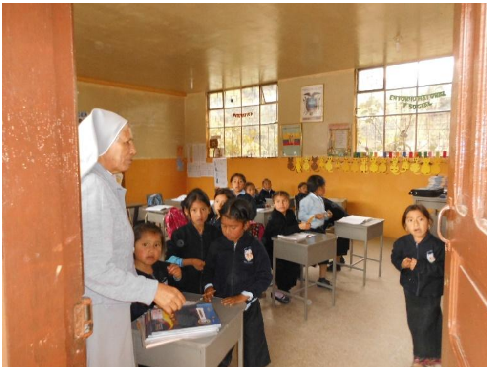
Fotografía Nº 6. Aula del 2do Año de Básica.