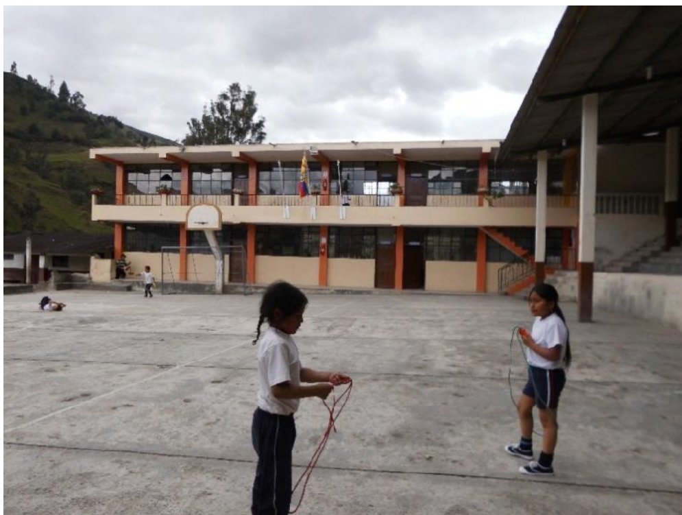
Fotografía N° 2. Cancha principal