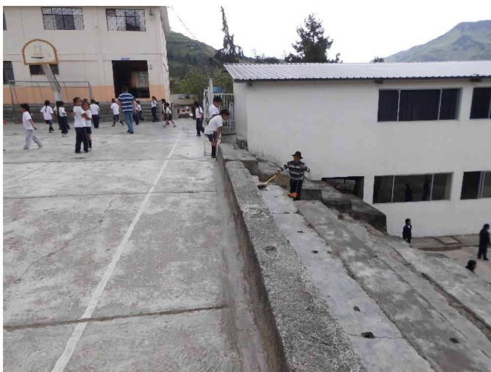
Fotografía N° 4. Enfoque de la cancha secundaria.