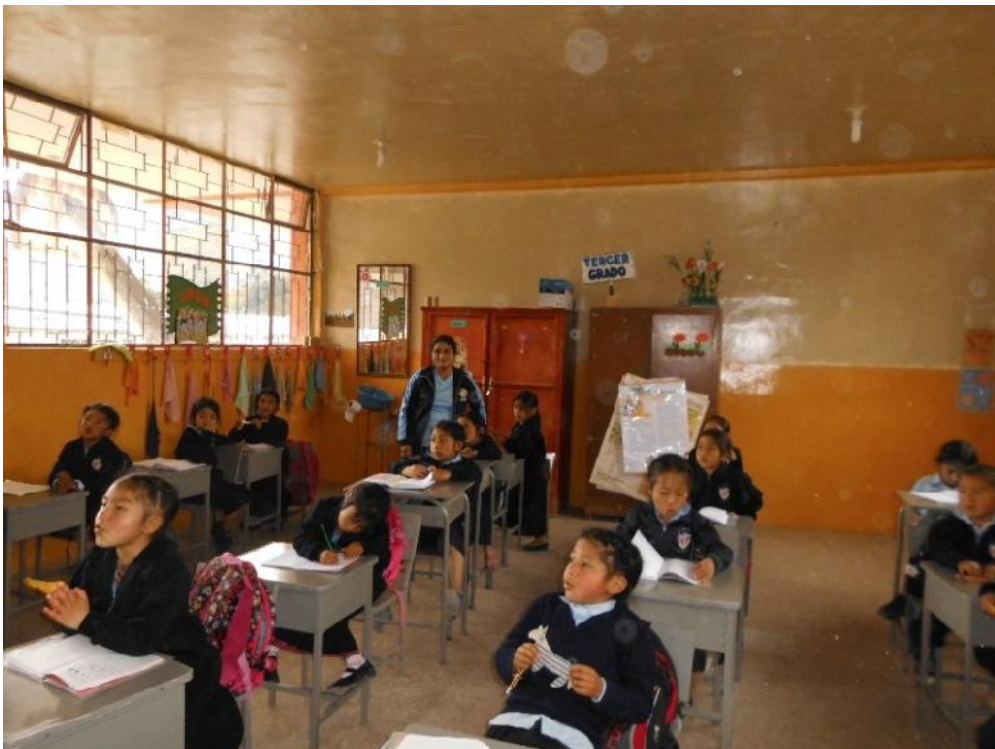
Fotografía Nº 10. Niños sentados atendiendo la clase.