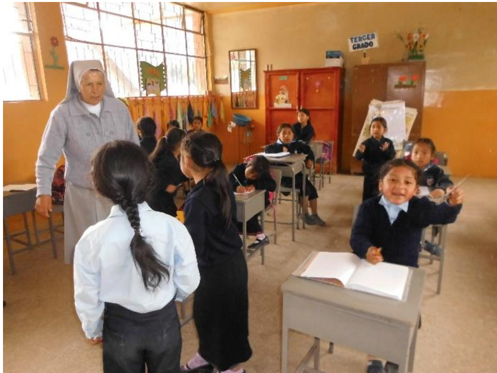
Fotografía N° 7. Niños acercándose a la profesora, preguntándole sus inquietudes.