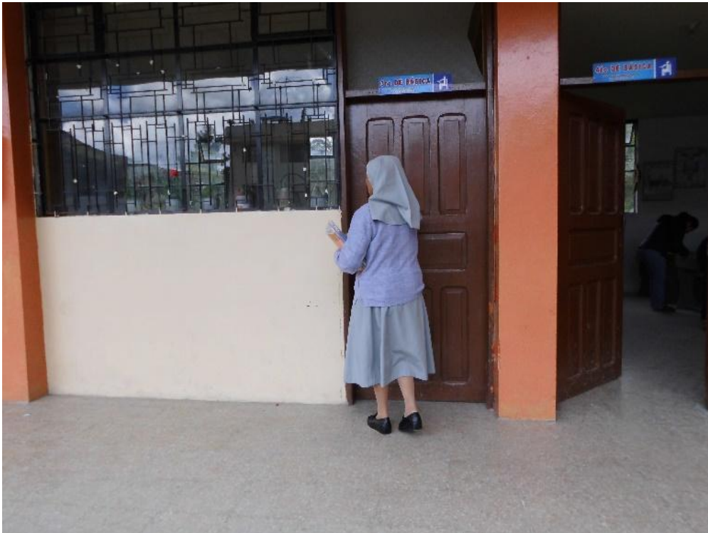
Fotografía Nº 5. Ingreso al aula del 2do Año de Básica