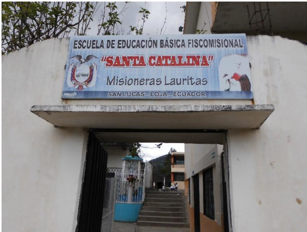
Fotografía N° 1. Entrada a de la escuela "Santa Catalina"