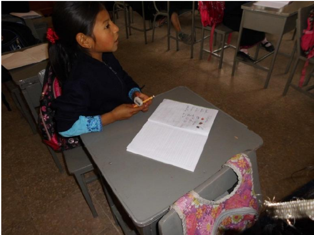
Fotografía N° 11. Niña sentada muy atenta