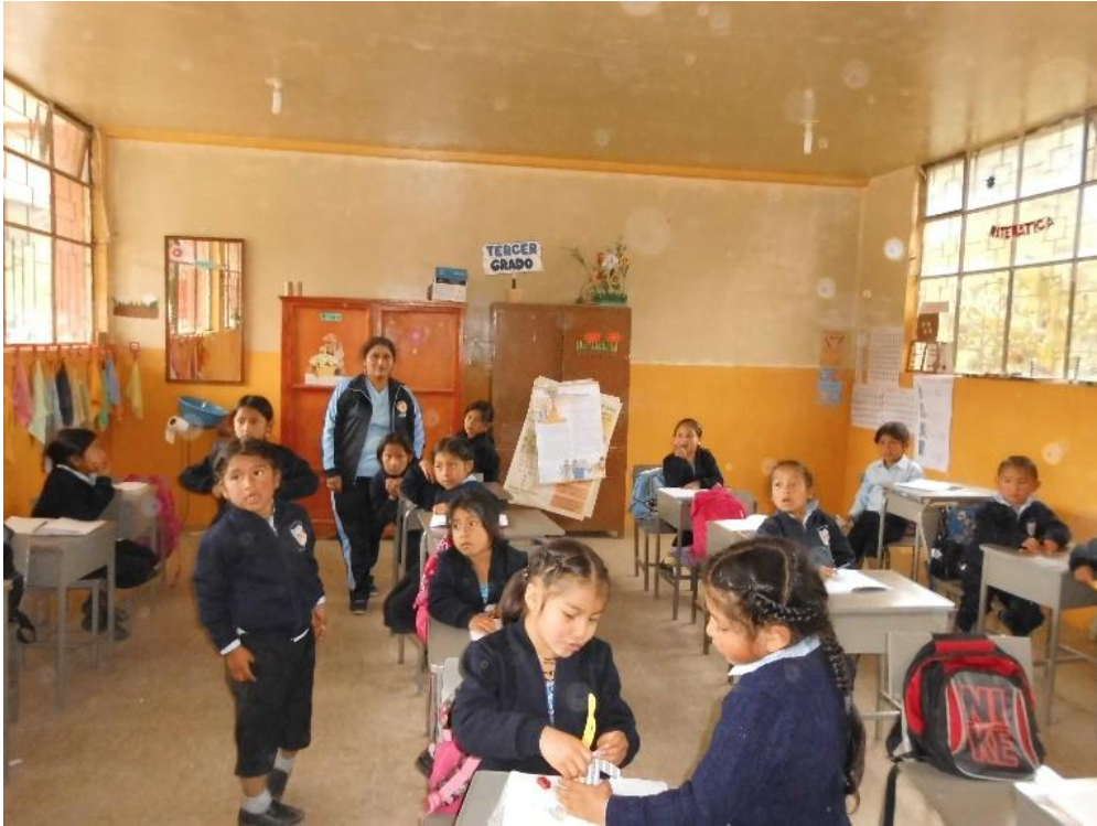
Fotografía Nº 9. Niños copiando lo escrito en la pizarra. .