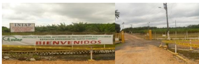
Ilustración No. 1 Iniap