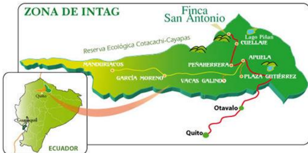
Mapa 1: Ubicación del Valle de Intag