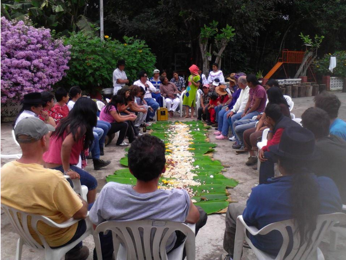
REUNIÓN 2 CON TURISTAS Y AUTORIDADES ADMINISTRATIVAS DE LAS TERMAS DE NANGULVÍ (2013)