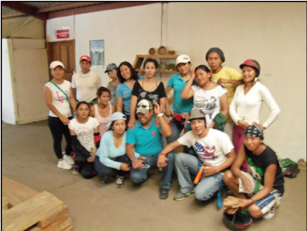
GRUPO DE ESTUDIANTES QUE HICIERON CANOPY EL DIA DE LA REINAGURACIÓN