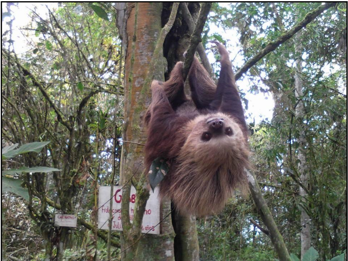
GUALIMÁN- PEÑAHERRERA- INTAG- ECUADOR