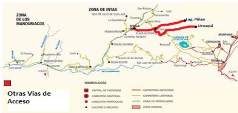
Mapa #7: Otras Vías de Acceso a la Zona de Intag

Fuente: www.mundointag.blogspot.com Elaborado por: Estephania Chávez