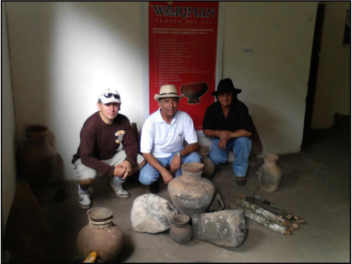
MUSEO KITU KARA- GUALIMAN- PEÑAHERRERA- INTAG