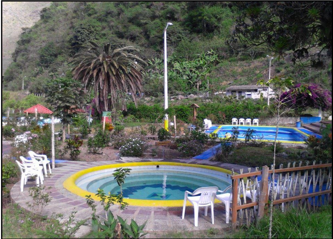
TERMAS DE NANGULVÍ 2014