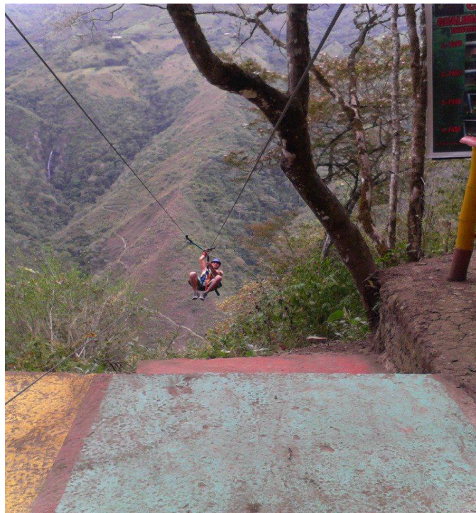
CANOPY GUALIMÁN 2013