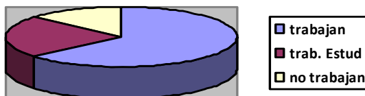
Ilustración 2: ¿Cuántos jóvenes estudian y trabajan?

Aspectos como estos demuestran claramente que los jóvenes Shuar son explotados laboralmente y esto no les ha brindado una verdadera calidad de vida, entendida como aquella que integra el bienestar físico, mental, ambiental y social como es percibido por cada individuo y cada grupo. Dependen también de las características del medio ambiente en donde éste proceso tiene lugar ya sea urbano y/o rural.